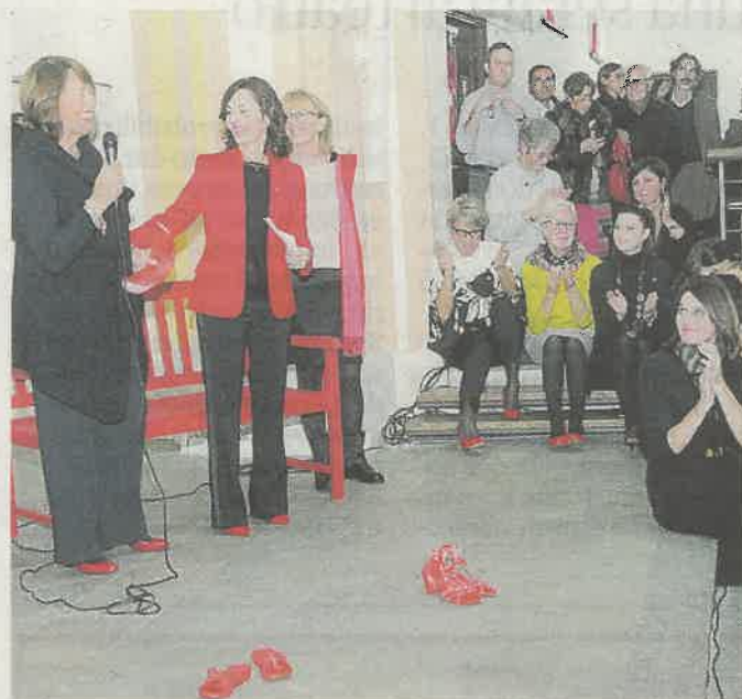
Una foto della giornata internazionale contro la violenza sulle donne

In particolare i contributi del mondo del Carnevale di Ivrea, che è stato coinvolto attraverso una serie d'incontri organizzati con i direttivi delle nove squadre di aranceri a piedi per condividere le progettualità, raccogliere idee e suggerimenti per arrivare, in occasione dell'edizione 2018