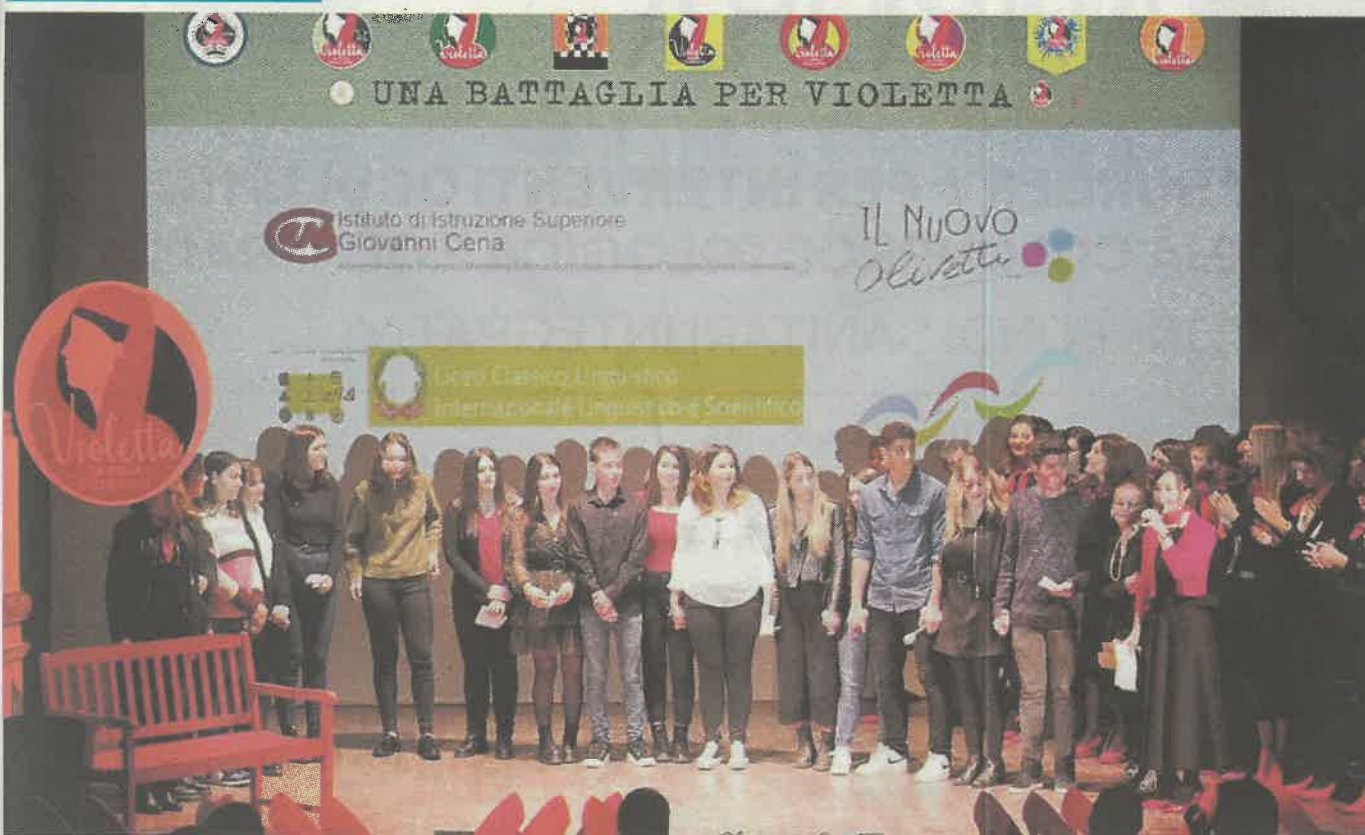
Un evento pubblico con le scuole superiori di Ivrea lo scorso anno